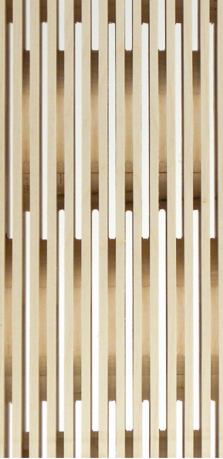
front & back side: 4/4 mm, 3-layer spruce